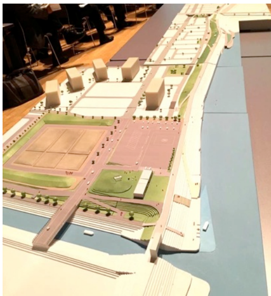
写真② かわまちづくり模型

協議会で検討を進めている 公園の模型やパネルの展示と、 名取市等関係各課で検討して いる事業の模型や航空写真を 展示して、まちづくりの現状 をわかりやすくお伝えします。 皆さんの悩みや不安をお聞 ききするコーナーも設けます。 仙台高専・坂口研究室をはじめ、多くの方々にご協力いただいています