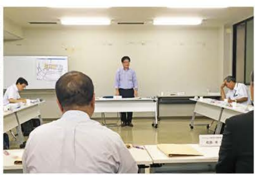
写真 実行委員会の様子

本協議会はまちびらきに向け、実行委員会の中でも提案しました(仮称)プレゼン大会の企画を進めてまいります。老若男女みんなでまちびらきを考える機会をつくっていきたくて考えています。