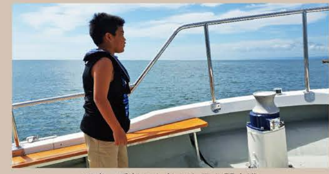
写真 乗船した船から見た閑上港

民間が運営する舟運が始まったので、週末クルージングに参加しました。この日は風がないとの事で外洋まで航行。(N.ひろし)