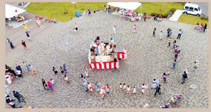
写真 集合住宅の上層階から見た盆踊りの様子

閑上中央第一団地にて閑上での盆踊りが復活しました。小雨でしたが、浴衣の方や仮装の方が多数参加しました。(U.ひさお)