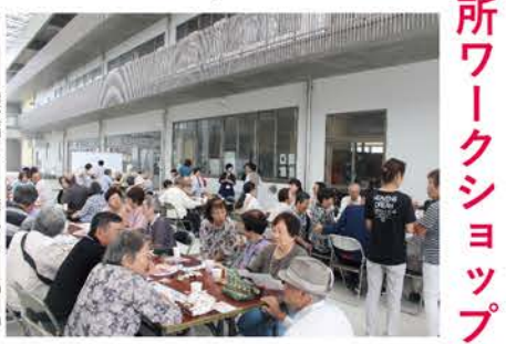
写真 住民顔合わせ交流会の様子