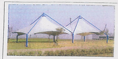
大型テントのイメージ

海を望む丘ゾーン【約 7,200 m 2 】 【北の丘の高さ GL+4.5m】【南の丘の高さ GL+4.0m】 ●ゆりあげ港朝市と遺構と伝承ゾーンとを直線でつなぐ連絡導線を設置し、丘として公園が守られている雰囲気を出し ●丘は、日和山を越えない範囲で、かつ海沿いに設置される堤防を越えて広浦を眺められる高さに設定し、園内や市内遠望・広浦の風景を楽しめる憩いの場として整備