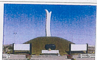
名取市東口太田公園慰霊碑

折りのゾーン【4,630 m 2 】 ●慰霊碑（現在地）を360度拝めるような円形広場 ●折りのゾーンの周囲に土塁（H=1.2m）で同心円状に囲むことで、円形広場の領域性を表現 ●広場は、透水性コンクリート舗装で領域性を創出 ●芳名板は、重量感のある石材で折れ敷地