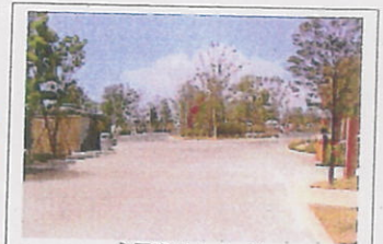
主園路のイメージ

主園路【約 1,400 m 2 】 ●折りの広場・日和山と朝市を結ぶ公園の主動線 ●朝市と日和山をつなぐ景観軸を形成