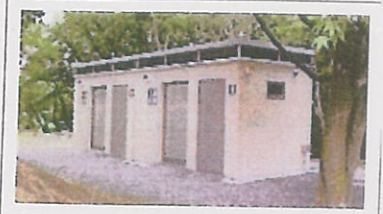
トイレのイメージ

休憩施設【約 650 m 2 】 ●雨天時においても語り部と共に集うことが可能な大型テントを主動線沿いに設置 ●トイレなど、日常の公園利用者に必要な施設を併設 男子：小2穴、大1穴、女子：3穴、多目的：1穴